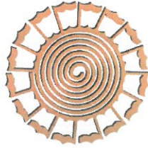
Biblioteka Kombëtare e Kosovës "Pjetër Bogdani"